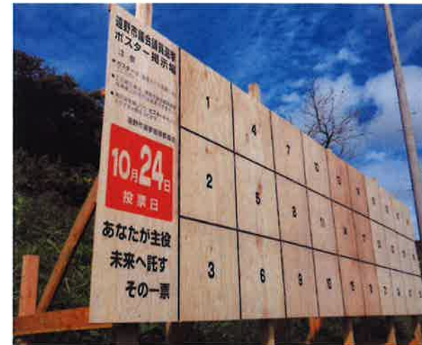
岩手県 T市 素材：県産杉間伐材使用合板