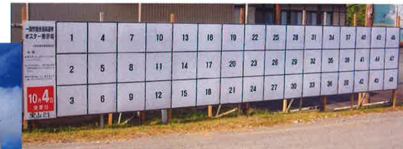
岩手県 I市 素材：STボード